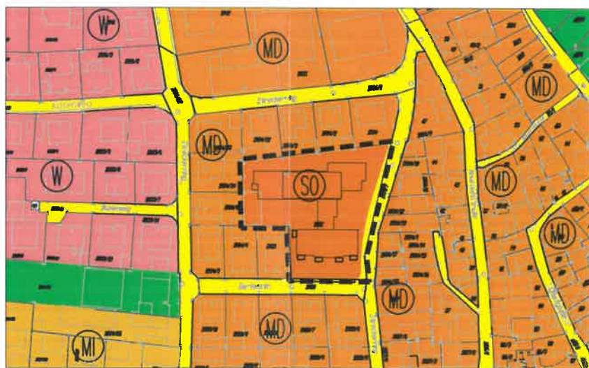
FLÄCHENNUTZUNGSPLAN M. 1 : 2.500 ÄNDERUNG