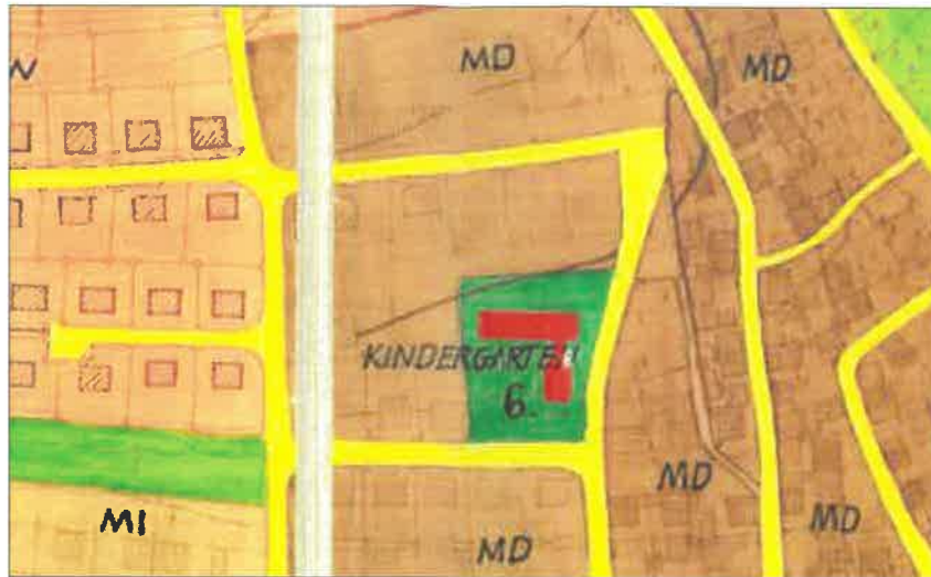
FLÄCHENNUTZUNGSPLAN M. 1 : 2.500 BESTAND